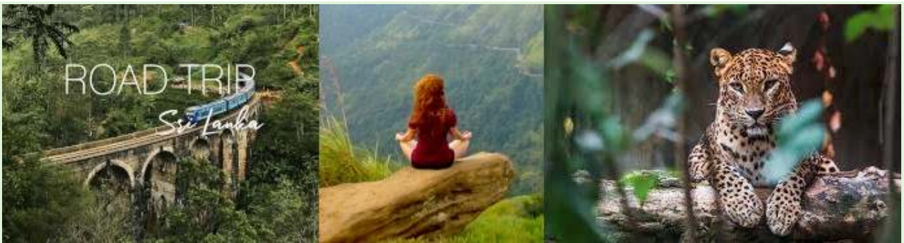
Sri Lanka Urlaub - Geführte Naturtouren und Expeditionen

Zeitpunkt: Das Experiment wurde während der COVID-19-Pandemie gestartet, als Sri Lankas vom Tourismus abhängige Wirtschaft bereits stark beeinträchtigt war.