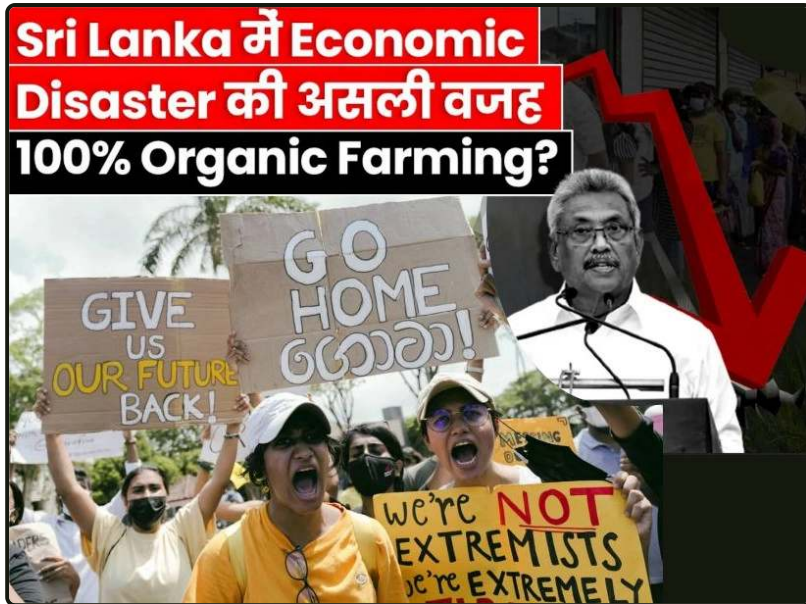
Wirtschaftskatastrophe in Sri Lanka